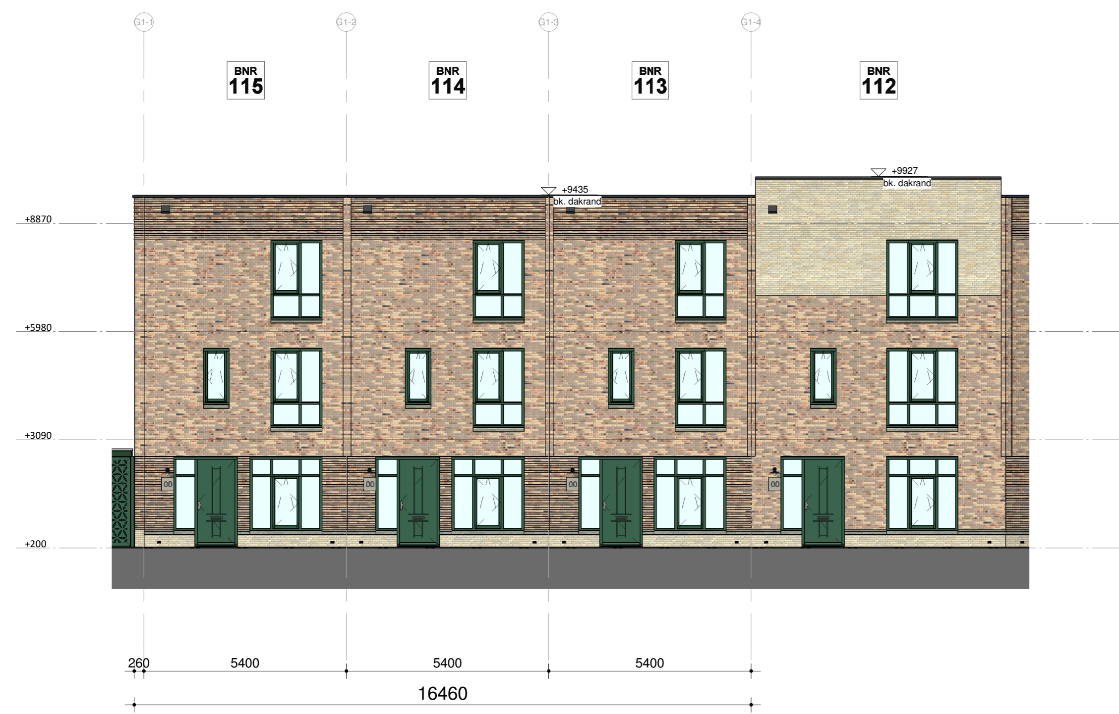
Blok 12B - voorgevel