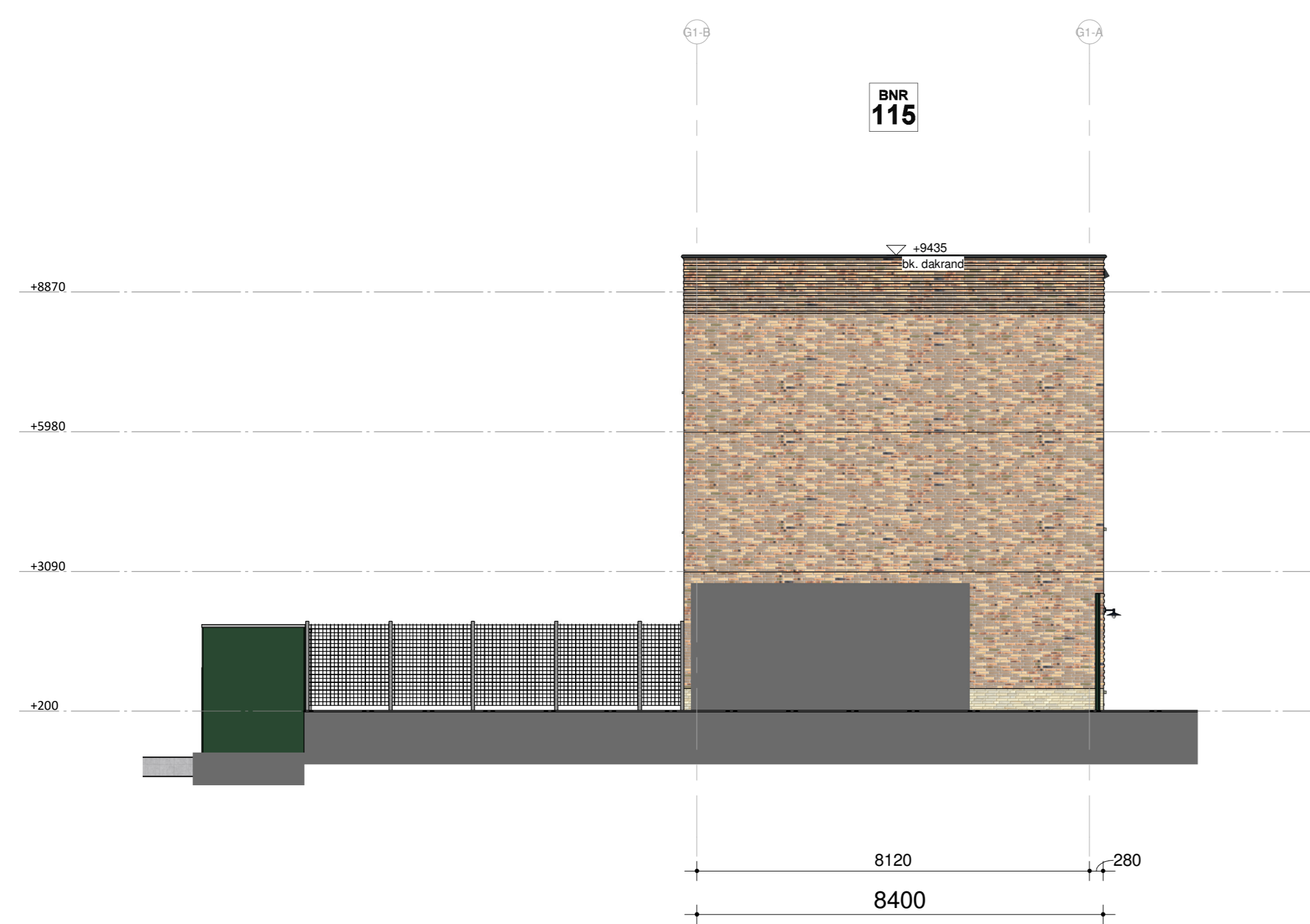
Blok 12B - zijgevel links