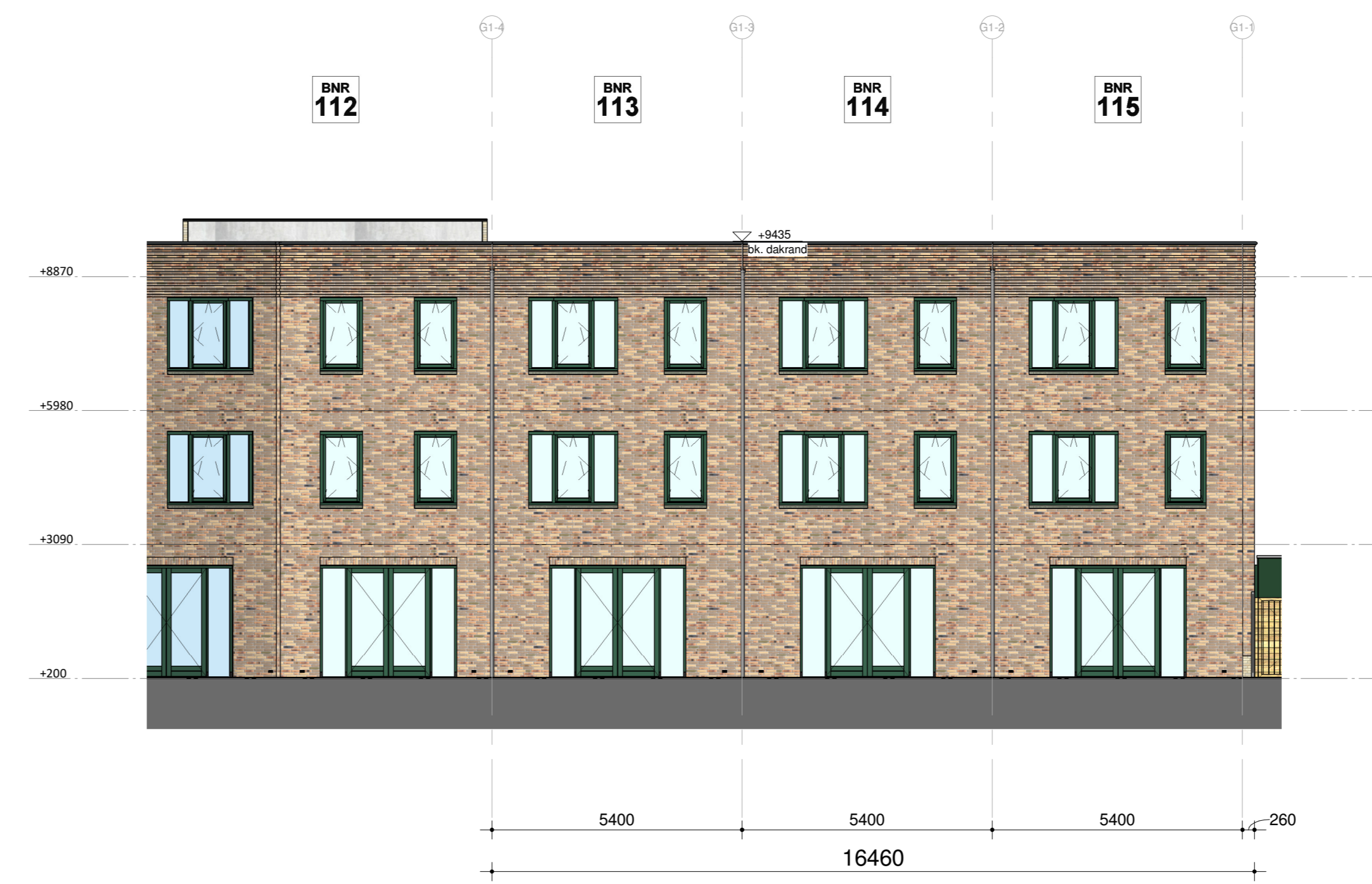
Blok 12B - achtergevel